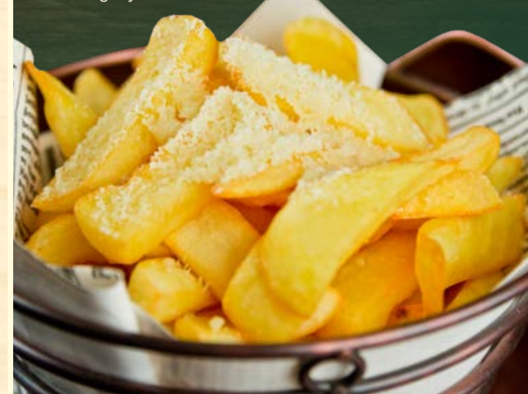
Parmezánnal megszórt, sült steakburgonya hasáb