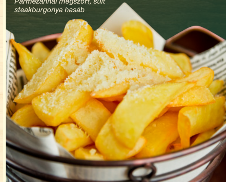
Parmezánnal megszórta, sült steakburgonya hasáb