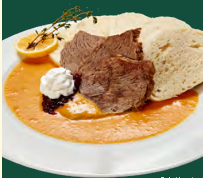
Sviečková na smotane

Filet Mignon 200 g 7 26,90 šťavnatý hovädzí steak z pravej sviečkovice z Nemecka