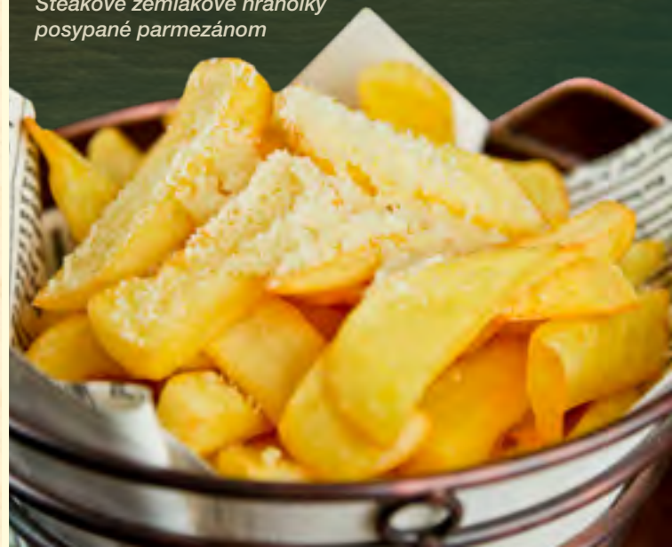
Steakové zemiakové hranolky posypané parmezánom